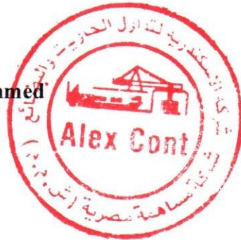
لواء بحرى / علاء محمد إبراهيم أحمد